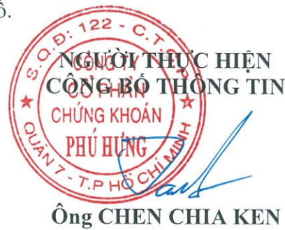
Ông CHEN CHIA KEN