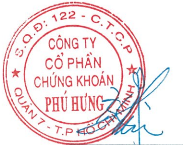
Chiu, Hsien-Chih Thành viên BKS Chủ tọa Cuộc họp 18/07/2018