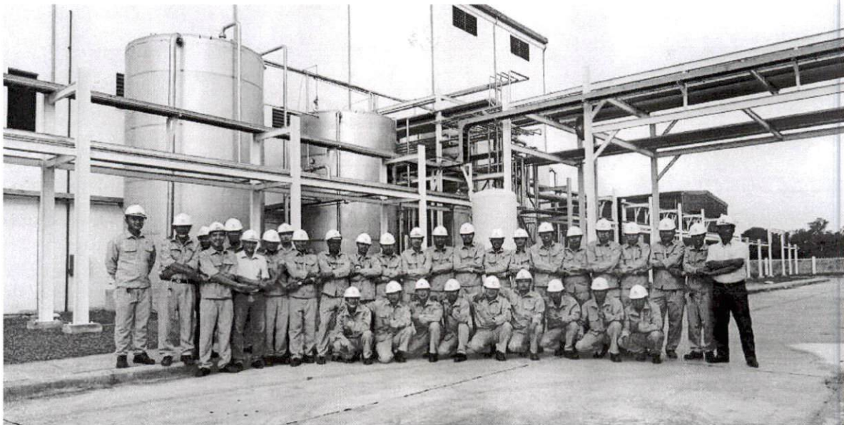
Hình 3. Hình ảnh công nhân tại nhà máy SOFAVI

Công ty luôn khuyến khích tất cả mọi người đối xử với nhau trên nguyên tắc: Tôn trọng – bình đẳng. Nhằm xây dựng một môi trường làm việc văn hoá, văn minh cho tất cả mọi thành viên của công ty.