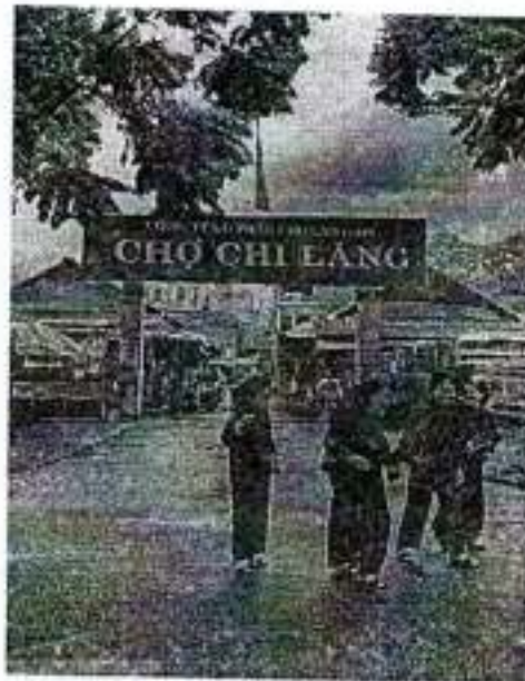
Hình 3. Chợ Chi Lăng - Lạng Sơn

Đây là khu chợ bán hàng thực phẩm duy nhất tại phường Chi Lăng, thành phố Lạng Sơn. Chợ nằm gần công viên và đại lộ của thành phố với diện tích là 3.706,3 m 2 gần các cơ quan ban ngành của địa phương.