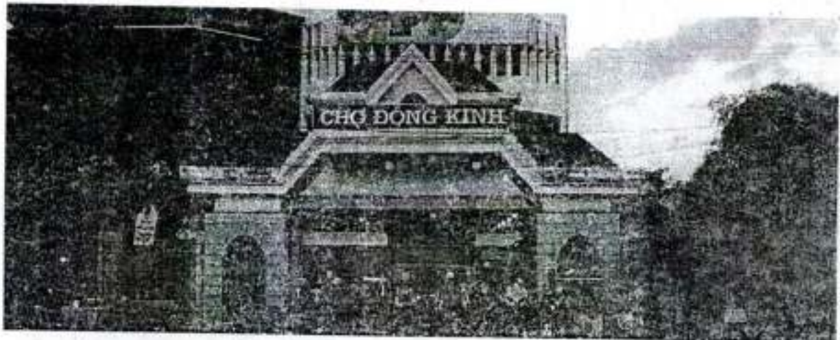
Hình 1. Chợ Đông Kinh - Lạng Sơn

Chợ Đông Kinh nằm tại phường Vĩnh Trại - trung tâm thành phố Lạng Sơn với diện tích là 8.409,8 m 2 , có bãi đỗ xe rộng, hệ thống nhà chợ có diện tích lớn nhất trong 03 Chợ; với thiết kế 3 tầng, tầng 1 bán đồ điện tử, tầng 2 bán hàng tạp hóa, tầng 3 bán hàng thời trang. Trước đây, Chợ Đông Kinh thuộc "Bạc dịch trường Vĩnh Bình" là nơi trao đổi thương mại, buôn bán giao thương của thương gia hai nước Việt - Trung, sau này chợ được xây dựng khang trang, ngày càng mua bán nhộn nhịp. Chợ hoạt động buôn bán cả ngày, luôn luôn nhộn nhịp đông đúc, đặc biệt là vào tháng chạp và tháng giêng, thời điểm diễn ra các lễ hội của thành phố Lạng Sơn và trên địa bàn cả tỉnh Lạng Sơn.