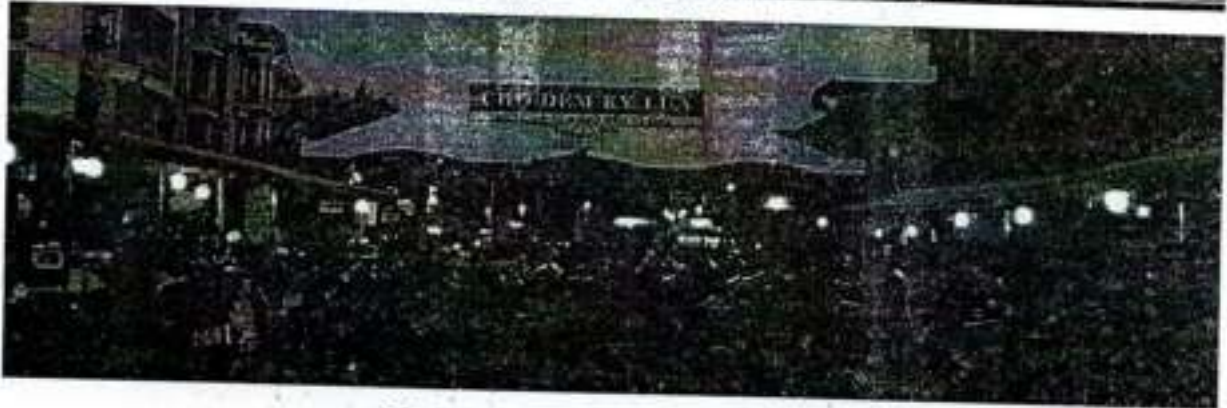
Hình 2. Chợ Kỳ Lừa - Lạng Sơn

Chợ Kỳ Lừa đặt tại phường Hoàng Văn Thụ, thành phố Lạng Sơn, nằm trên đường lên cửa khẩu biên giới có diện tích là 3.801,6 m 2 . Chợ bán một số mặt hàng truyền thống của người dân bản địa, kết hợp hàng nhập khẩu và hàng Việt Nam. Chợ Kỳ Lừa mở cửa cả buổi tối, các hàng quán ăn tại sân chợ mở cả đêm cho tới sáng nhằm đáp ứng nhu cầu tham quan, mua sắm của du khách.