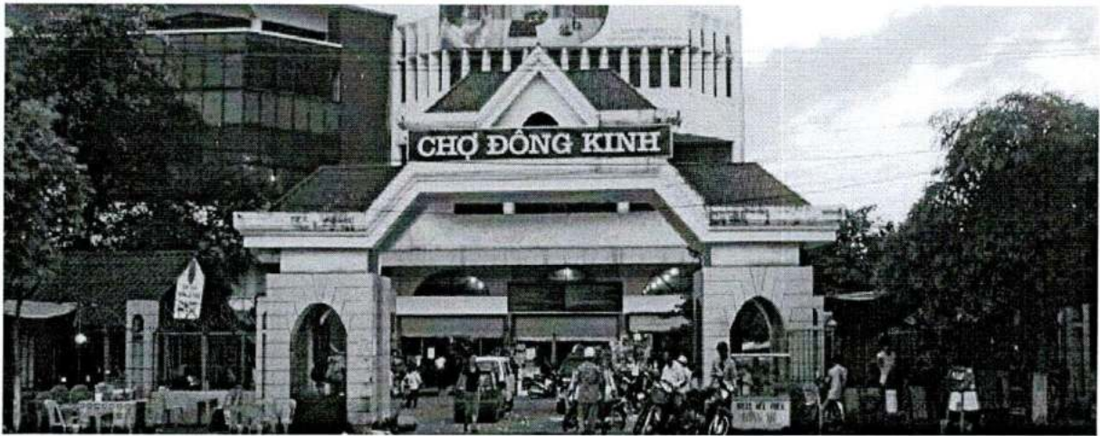
Hình 1. Chợ Đông Kinh - Lạng Sơn

Chợ Đông Kinh nằm tại phường Vĩnh Trại - trung tâm thành phố Lạng Sơn với diện tích là 8.409,8 m 2 , có bãi đỗ xe rộng, hệ thống nhà chợ có diện tích lớn nhất trong 03 Chợ; với thiết kế 3 tầng, tầng 1 bán đồ điện tử, tầng 2 bán hàng tạp hóa, tầng 3 bán hàng thời trang. Trước đây, Chợ Đông Kinh thuộc “Bạc dịch trường Vĩnh Bình” là nơi trao đổi thương mại, buôn bán giao thương của thương gia hai nước Việt - Trung, sau này chợ được xây dựng khang trang, ngày càng mua bán nhộn nhịp. Chợ hoạt động buôn bán cả ngày, luôn luôn nhộn nhịp đông đúc, đặc biệt là vào tháng chạp và tháng giêng, thời điểm diễn ra các lễ hội của thành phố Lạng Sơn và trên địa bàn cả tỉnh Lạng Sơn.