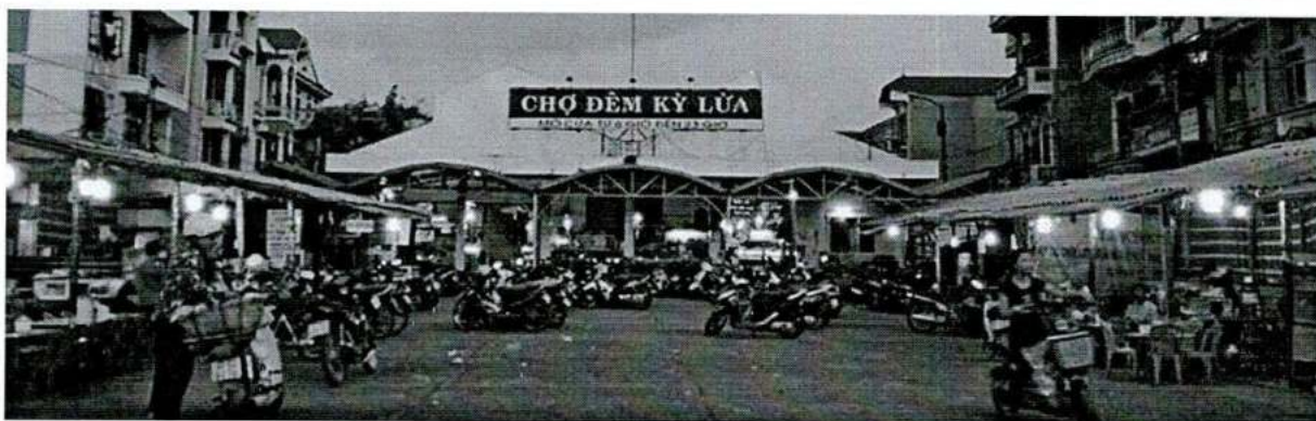
Hình 2. Chợ Kỳ Lừa - Lạng Sơn

Chợ Kỳ Lừa đặt tại phường Hoàng Văn Thụ, thành phố Lạng Sơn, nằm trên đường lên cửa khẩu biên giới có diện tích là 3.801,6 m 2 . Chợ bán một số mặt hàng truyền thống của người dân bản địa, kết hợp hàng nhập khẩu và hàng Việt Nam. Chợ Kỳ Lừa mở cửa cả buổi tối, các hàng quán ăn tại sân chợ mở cả đêm cho tới sáng nhằm đáp ứng nhu cầu tham quan, mua sắm của du khách.