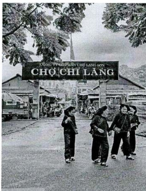
Hình 3. Chợ Chi Lăng - Lạng Sơn

Đây là khu chợ bán hàng thực phẩm duy nhất tại phường Chi Lăng, thành phố Lạng Sơn. Chợ nằm gần công viên và đại lộ của thành phố với diện tích là 3.706,3 m 2 gần các cơ quan ban ngành của địa phương.